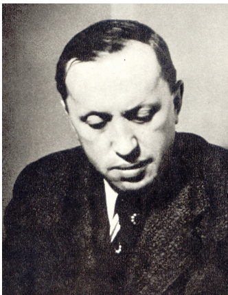
Karel Čapek - spisovatel, politik, patriot

Radnice je místo, kde by se měl každý občan cítit dobře a vítán. Nesouhlasíme teď s uzavřenou společností, kterou zajímá jen prospěchářství, a nebudeme se tak chovat ani my. Každý občan má mít dveře otevřené. Krok po kroku zrealizujeme sliby předchůdců a rozumné požadavky občanů. Cílem je fungující vedení radnice, které na nadcházející volební období 2022–2026 sjednotí komunální politická uskupení a povede diskuzi o důležitých rozhodnutích i s občany.