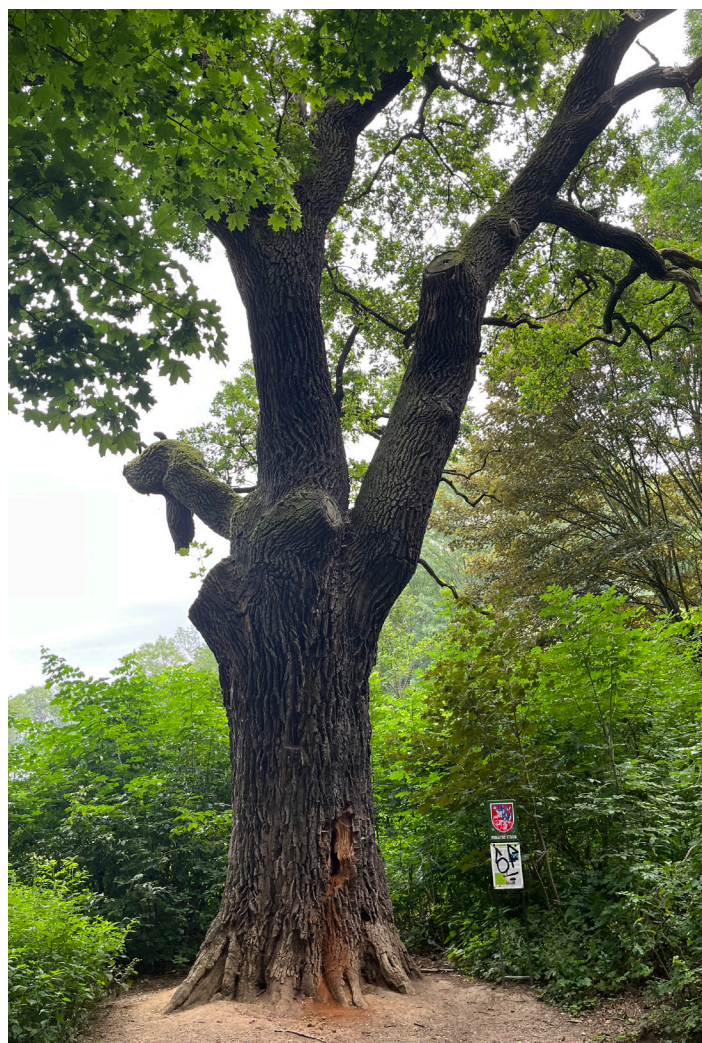
Hraniční dub v Uhříněveské oboře, která je v majetku Lesů ČR.

Obsah novin tvoříte i Vy, naši čtenáři. Náměty pište na adresu: redakce@obcanuhrineves.cz