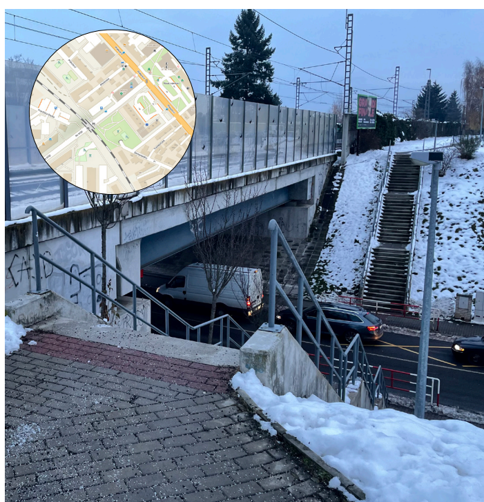
Kdokoli jde nyní podél železniční trati, musí komplikovaně sejít nahoru a dolů po schodech a opatrně přejít rušnou silnici. To by se za rok mělo změnit.