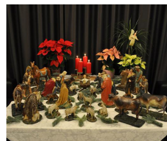
Barokní jesličky z kostela Všech svatých v Uhříněvsi, vystavené v uhříněveském muzeu v roce 2022