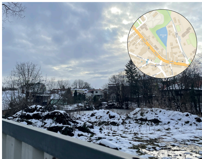
Cukrovarský rybník v centru Uhřetěvesi se konečně dočká důstojné podoby.

Rybník používal cukrovar jako zásobárnu potřebné vody, před několika lety byl odbahněn. V současné fázi úprav se dokumentují přilehlé budovy, pak přijde na řadu kácení nevhodných dřevin a příští rok v létě mají vzniknout nové opěrné zdi rybníka. Bude také upraveno koryto přilehlého potoka. V další etapě pak dojde na stavbu pochozí lávky kolem celé vodní plochy.