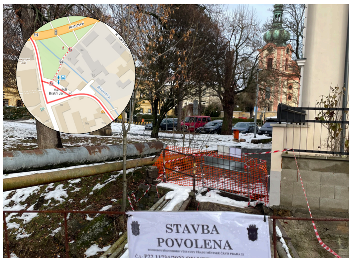
Lávka přes Říčanský potok na náměstí Bratří Jandusů, jejíž výměna trvala ostudných šest let.