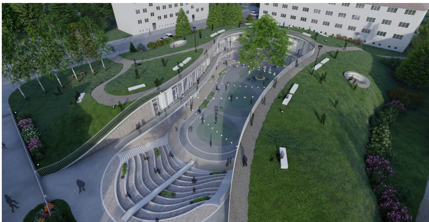
Vizualizace neuskutečněného projektu podzemní mateřské školy V Bytovkách

byla porušena zásada transparentnosti při zadávání veřejné zakázky. Přitom (citujeme z nálezu ÚOHS): „Zásada transparentnosti je jednou z klíčových zásad určujících požadavky na postup zadavatele, který musí zajistit zadání veřejné zakázky průhledným způsobem a obecně zajistit přezkoumatelnost svého postupu. Transparentnost procesu zadávání veřejných zakázek je nejen podmínkou existence účinné hospodářské soutěže mezi