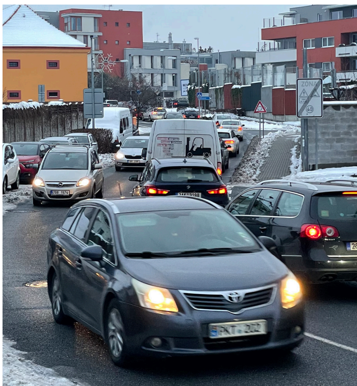
V přetížené ulici Žampionová dnes v Pitkovicích několikrát denně stojí fronta aut.

Stavba je nyní ve fázi změn územního plánu, ale k realizaci je ještě delší cesta než v případě zmíněné lávky. Jde o velkou stavbu a když vše půjde dobře, změna územního plánu potrvá nejméně dva roky. Následuje výběrové řízení na projektanta, dodavatele, samotný projekt, stavební povolení, stavba... Možná bude potřeba komplikované posouzení vlivu stavby na životní prostředí. Pokud se v tomto volebním období kopne do země, bude to výhra.