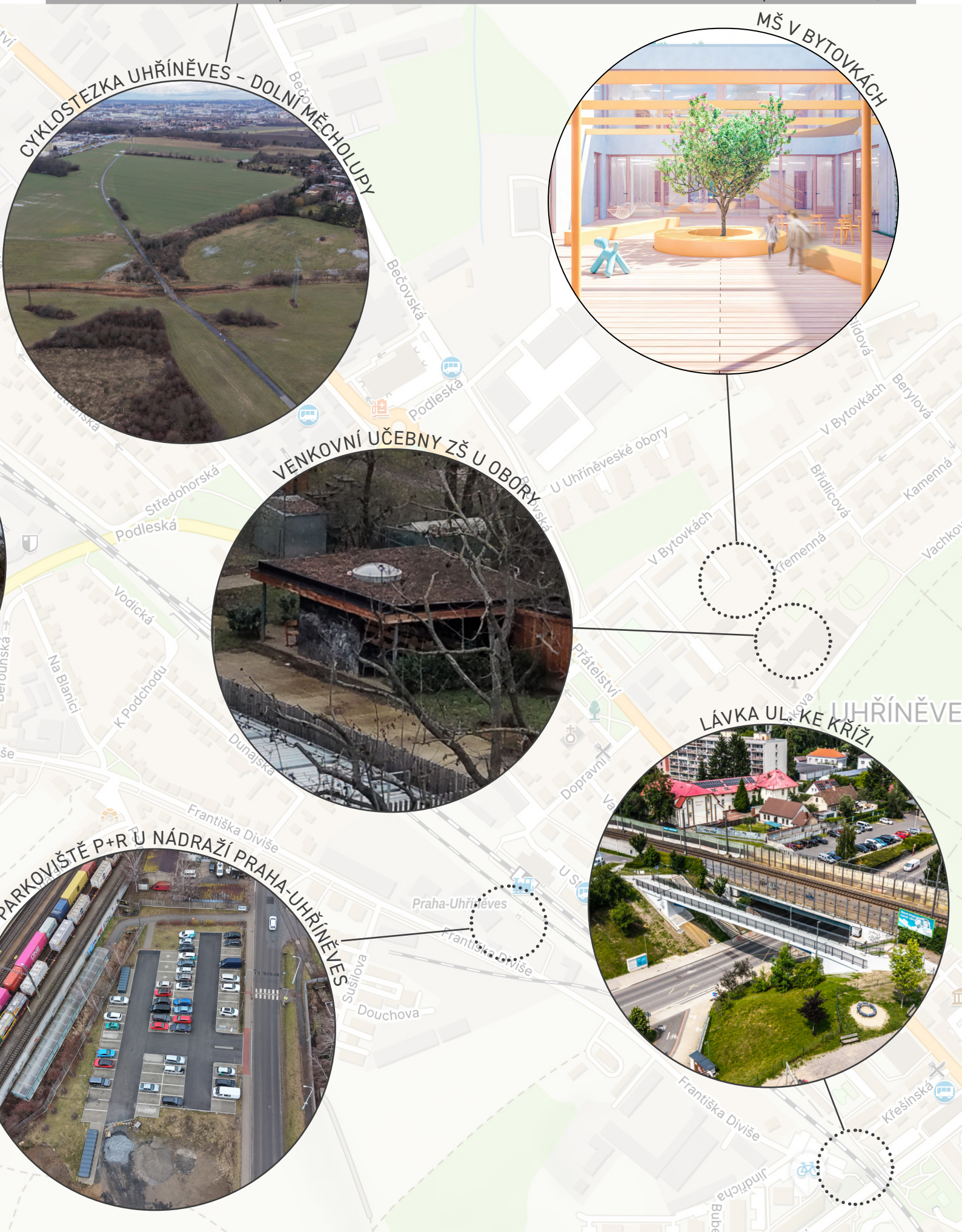
CYKLOSTEZKA UHŘINĚVES - DOLNÍ MĚCHOLUPY