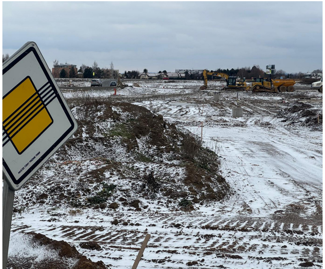
Na budoucím dálničním okruhu pracují stavbaři i v zimě.

UHŘETĚVESKÉ OBČANSKÉ NOVINY ROČNÍK VII, ČÍSLO 2 VYCHÁZÍ JÍ: 12X ROČNĚ, V NÁKLADU 7300 KUSŮ, NEPRODEJNÉ VYDAVATEL: ASTRÁIA, SPOL. S. R. O., POD MARKÉTOU 87, PRAHA 10-HÁJEK, REDAKCE@OBCANUHRIEVES.CZ ODPOVĚDNÝ REDAKTOR: JAN VORLÍČEK IČ: 25758179, EV. Č. MK ČR E 24047 VYDÁNO DNE: 19. 2. 2026 ČLÁNKY A FOTA BEZ UVEDENÍ ZDROJE JSOU REDAKČNÍ MATERIÁLY.